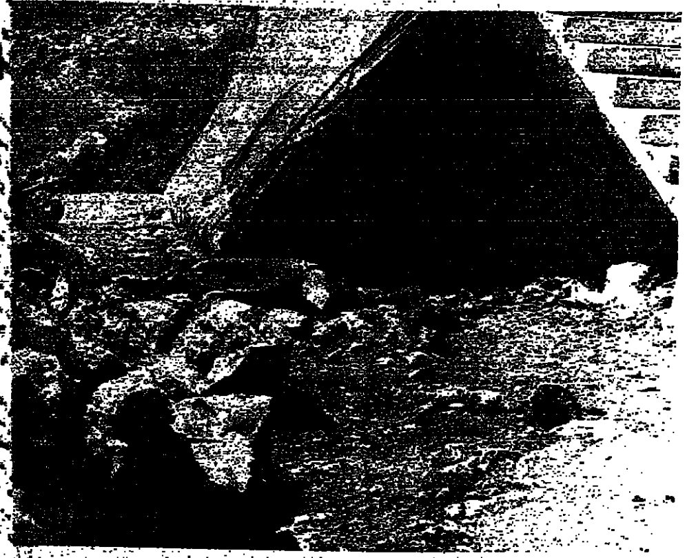
جثة أحد الشهداء العسكريين في عيننا الشعب أمس